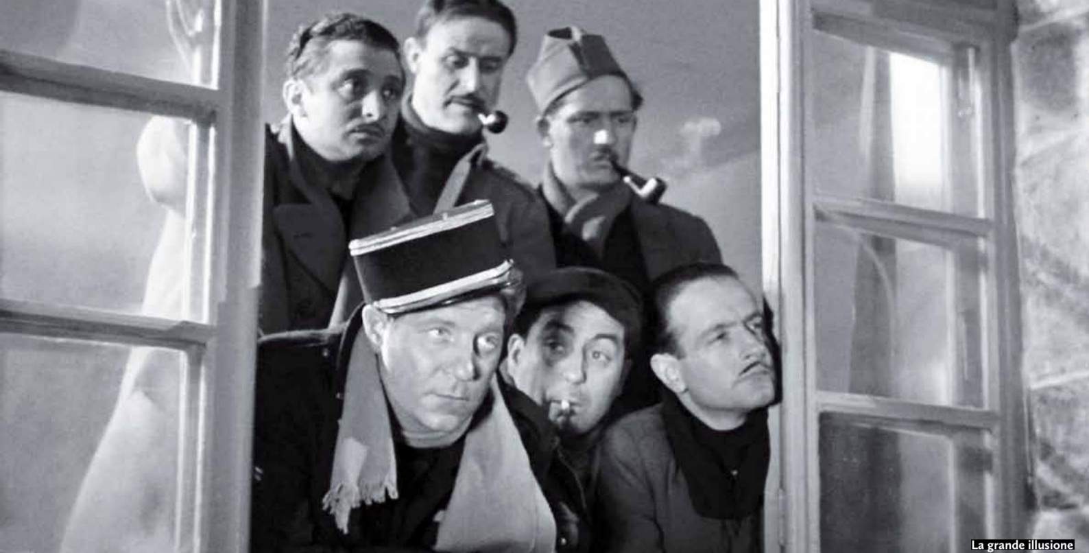
La grande illusione