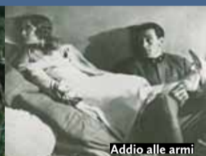
Addio alle armi