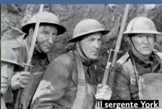
Il sergente York