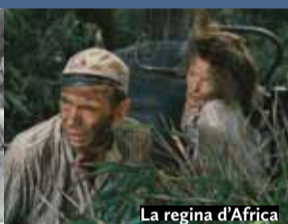
La regina d'Africa